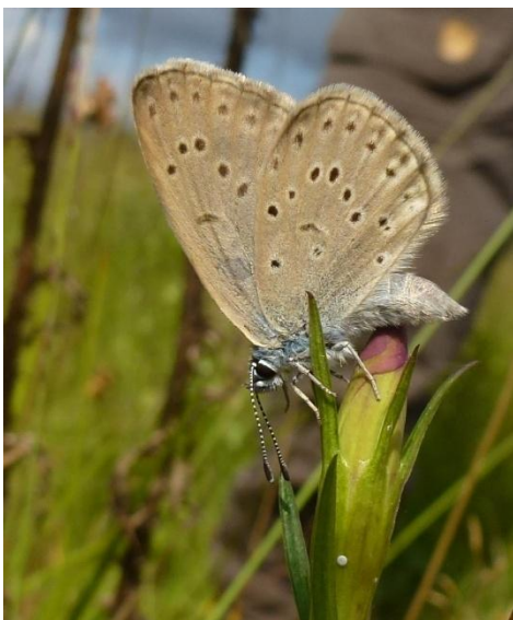
Gentiaan blauwtje op klokjesgentiaan, met afgezet eitje

Op woensdag 11 december 2013 heeft Ghis Palmans ons vergast op een zeer interessante avond over het wel en wee van het Gentiaan blauwtje in het Hageven en daar buiten. We hebben gehoord hoe de opvolging en de bescherming in het Hageven, maar ook in Europa een hele evolutie heeft doorgemaakt en dat er toch wel het één en het ander geleerd is gedurende die jaren.