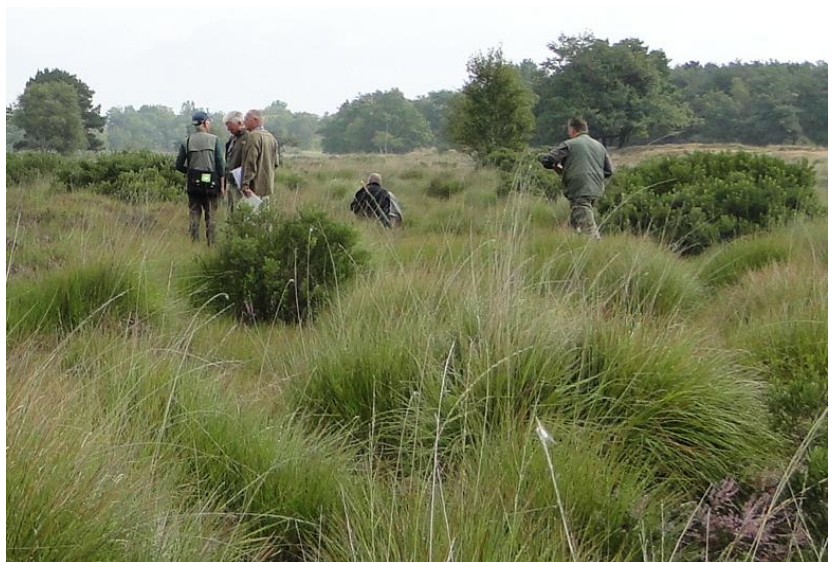
Mensen in het veld bij het tellen van de eitjes.